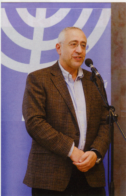
Телеведущий, член Общественной палаты РФ Николай Сванидзе

торый не имеет precedентов в истории Второй мировой войны», — рассказал Николай Сванидзе.