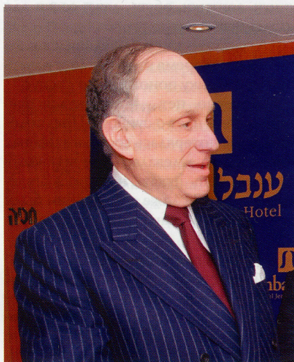
Резолюция была принята при активной поддержке президента ВЕК Рональда Лаудера

«Всемирный еврейский конгресс решительно осуждает террористический акт в рейсовом автобусе в Волгограде (Россия) и глубоко скорбит в связи с гибелью шести невинных людей,