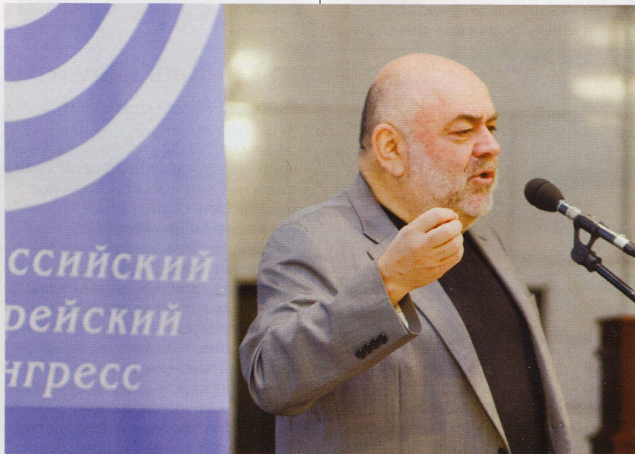
Президент РЕК Юрий Каннер

«Прошло 70 лет, а герои Собибора не удостоены наград, — напомнил в своем выступлении Юрий Каннер. — Возможно, потому что они были в плену, а у нас нет традиции награждать военнопленных. Возможно, потому что они были евреями». Глава РЕК отме-